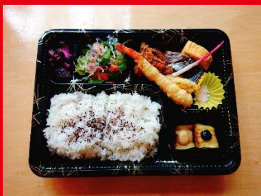
幕の内弁当 700円 税込 756円