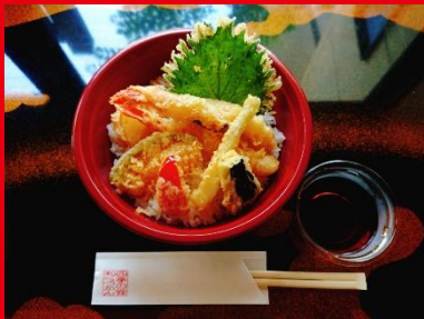
天丼 600円 税込 648円