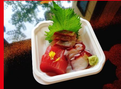
刺身(小) 600円 税込み 648円