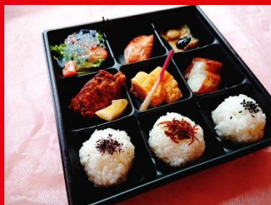
レディース弁当 600円 税抜648円