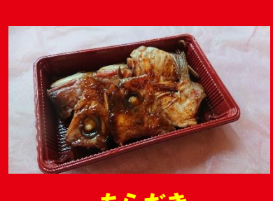
あらだき 数量限定 700円 税込 756円