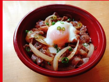
黒毛和牛すきやき丼 800円 税込 864円