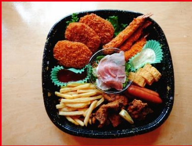
おかずセット (3名分) 1,500円 税込 1,620円