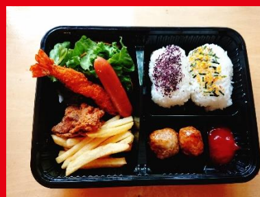
お子様弁当 500円 税込 540円