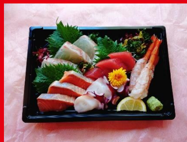
刺身(大) 1,500円 税込 1,620円