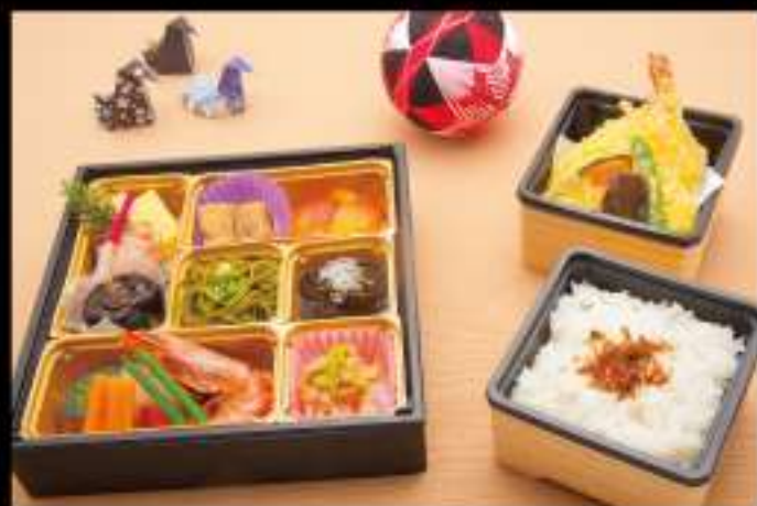
花梨 (かりん) 2,000 円 (税込 2,160 円)