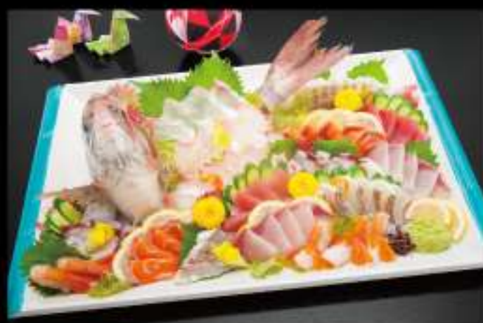
お刺身盛り 7,000 円 (税込 7,560 円)