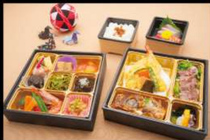
秋桜 (こすもす) 3,500 円 (税込 3,780 円)