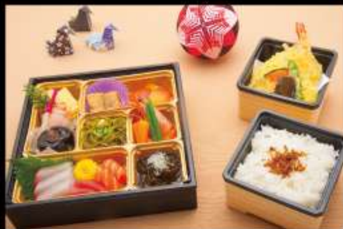
百合 (ゆり) 2,500 円 (税込 2,700 円)