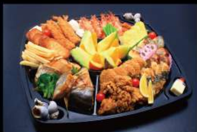
オードブル 6,000 円 (税込 6,480 円)

弁当 2,000 円 (税込 2,160 円)～ オードブル 5,000 円 (税込 5,400 円)～ お刺身盛り合わせ 6,000 円 (税込 6,480 円)～ ※舟盛りは 15,000 円 (税込 16,500 円)～ 上記金額よりご予算に合わせてご用意致します。