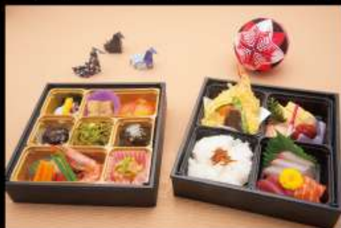
牡丹 (ぼたん) 3,000 円 (税込 3,240 円)